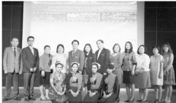
ศพกรรมศาสตร์วิชาการ... โรงเรียนการเรือนมหาวิทยาลัยราชภัฏสวนดุสิต จัดงานศพกรรมศาสตร์วิชาการ ครั้งที่ 4 "วัฒนธรรมไทยกับอาเซียน" ซึ่งกิจกรรมภายในงานมีกิจกรรมอภิวุฒิสถิตการท่าอากาศยาน การแกะสลัก ร้อยผ้ามลายู และนิทรรศการวัฒนธรรมไทยกับอาเซียน ภายใต้หัวข้อ "และโครงการศพกรรมศาสตร์วิชาการต่างๆ ของสำนักศึกษา ณ คณะศิลปกรรมศาสตร์ มสส."

รหัสขาว: C-140711018141 (11 ก.ค. 57/07:52)